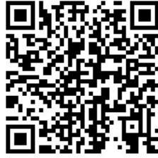
展位申请通道二维码

元，支付完毕后等待组委会审核。组委会将对支付过订金或展位费的申请按照时间先后顺序，统一分配展位。